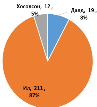
Ашиглалтын технологи /уулын ажлын тайлан/

Ашигт малтмалын төрлөөр нь авч үзвэл алтны үндсэн ордын 10, алтны шороон ордын 99, нүүрсний 55, шохойн чулууны 15, төмрийн хүдрийн 14, хайлуур жоншны 30, бусад ашигт малтмалын 19 уурхай тус тус тайлан ирүүлсэн байна.